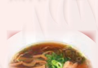
しょうゆラーメン