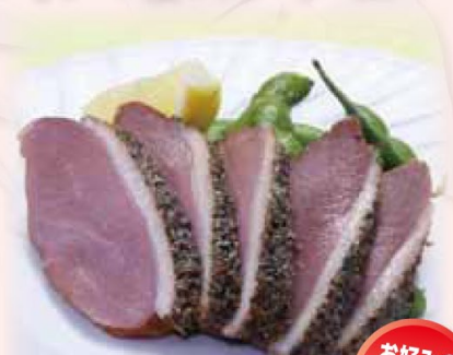
合鴨パストラミ&枝豆

ピリッと効いたブラックペッパーがアクセントの合鴨と定番おつまみの枝豆をセットにしました。