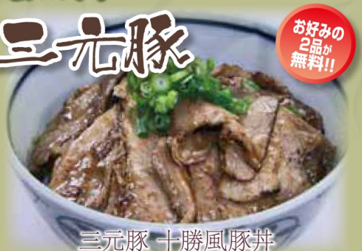
三元豚 十勝風豚丼

話題のみつせ鶏をシンプルな塩ラーメンに仕上げました。あっさり感の中にコクと旨味が凝縮された逸品です。