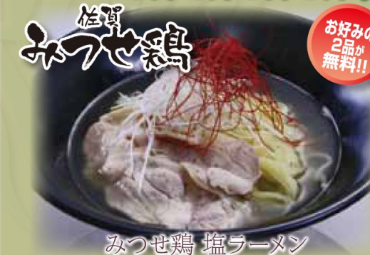
みつせ鶏 塩ラーメン

話題のみつせ鶏をシンプルな塩ラーメンに仕上げました。あっさり感の中にコクと旨味が凝縮された逸品です。